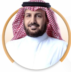
د. عايض بن فرحان القحطاني الرئيس