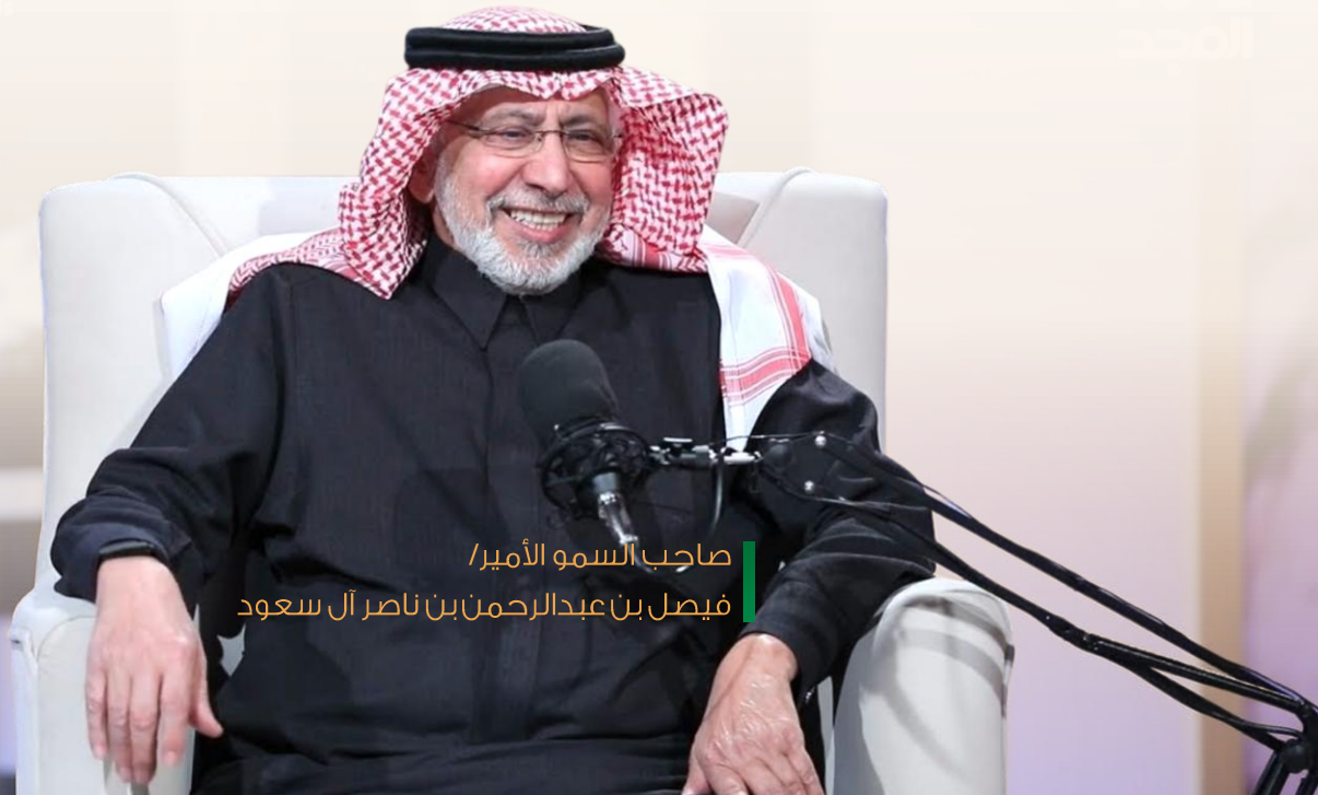
صاحب السمو الأمير / فيصل بن عبدالرحمن بن ناصر آل سعود