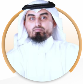
م. عاصم بن مشيب القحطاني نائب الرئيس